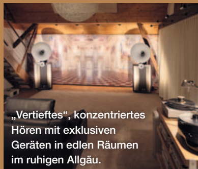
„Vertieftes“, konzentriertes Hören mit exklusiven Geräten in edlen Räumen im ruhigen Allgäu.

Im oberen Stockwerk ermöglichen ausgesuchte High-End-Perlen auf 150 Quadratmetern in drei Hörräumen das Eintauchen in HiFi-Klangräume mit dem Ausloten des technisch Machbaren. Plattenspieler, Streamer, Servertechnik und CD-Player spielen zu, zum Klingen bringen die Signale ausschließlich Hornlautsprecher von Avantgarde Acoustic.